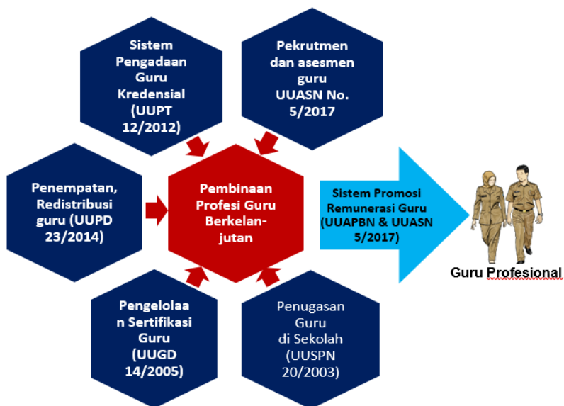
Gambar 2 Kerangka Berfikir: Mencegah Fragmentasi dan Memupuk Kesatuan yang Sinergik

(52) LPTK yang tugasnya menghasilkan guru baru ( kredensial teacher ) harus merupakan bagian integral dari sistem besar tatakelola guru nasional. Guru profesional adalah konsep yang dinamis, tidak mungkin diwujudkan hanya oleh pendidikan guru (LPTK atau PPG) tetapi juga sistem lain seperti rekrutmen, pembinaan profesi berkelanjutan, penempatan, sertifikasi, asesmen, promosi dan remunerasi, dan sistem perlindungan guru. Dengan fragmentasi peraturan perundangan yang berlaku maka sinergi antar-instansi terkait dalam mewujudkan guru yang benar-benar profesional sulit diwujudkan.